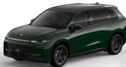
Glazed Green (metallic) €0,- Kleurcode: 0YF