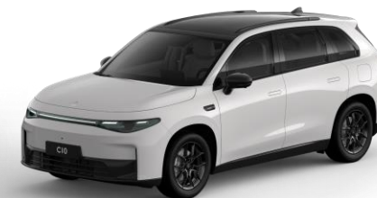
Pearly White (metallic) €800,- Kleurcode: 0AH (enkel uit voorraad)