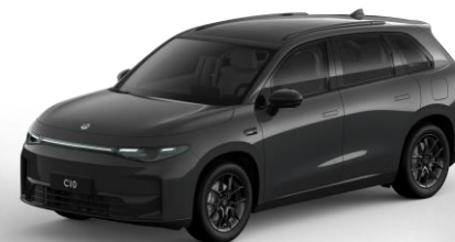
Canopy Grey (metallic) €800,- Kleurcode: 0GM