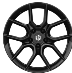
18" lichtmetalen velgen