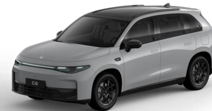
Tundra Grey (non metallic) €800,- Kleurcode: 0GD