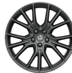
20" lichtmetalen velgen