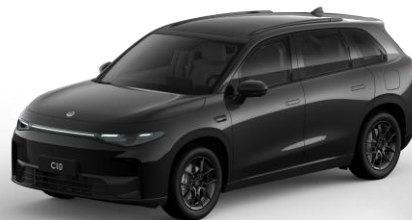
Metallic Black (metallic) €800,- Kleurcode: 0KL